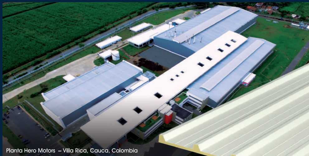
Planta Hero Motors – Villa Rica, Cauca, Colombia